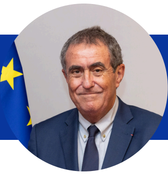
Jean-Pierre AUDY (PPE 2005-2014, France) Trésorier de l'AAD

Jean-Pierre Audy a été membre du Parlement européen de 2005 à 2014. Il a été vice-président de la commission du contrôle budgétaire de 2009 à 2012, vice-président de la délégation pour les relations avec les pays du Mercosur de 2010 à 2014 et président de la délégation française du groupe PPE de 2010 à 2014.